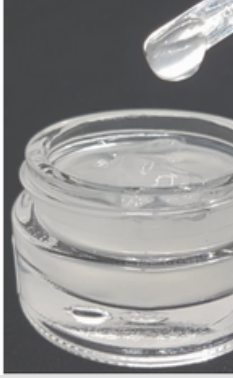
Diğer Şeffaf Serum Bazı