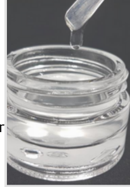
Hydagen Şeffaf Serum Bazı